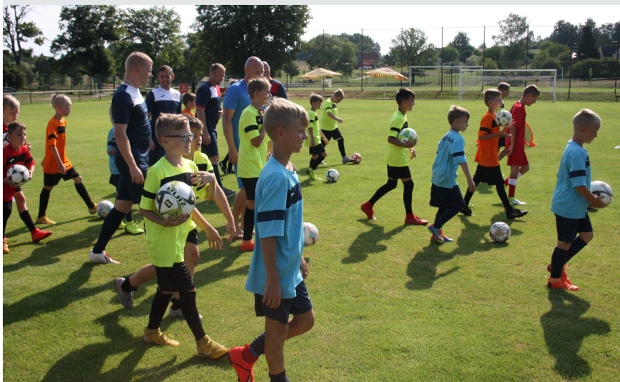
Finanční podporu od nás získal na vybavení pro děti i fotbalový klub FK Baník Albrechtice.