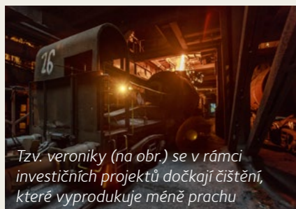
Tzv. veroniky (na obr.) se v rámci investičních projektů dočkají čistění, které vyprodukuje méně prachu

V listopadovém mimořádném čísle zpravodaje jsme vás informovali o ekologických investicích v celkové hodnotě 4,1 miliardy Kč, z nichž většina bude dokončena do konce roku 2015. Nejsou to však všechny probíhající investice do zlepšení životního prostředí. Huť pracuje i na dalších šesti dotovaných projektech v celkové hodnotě více než půl miliardy korun.