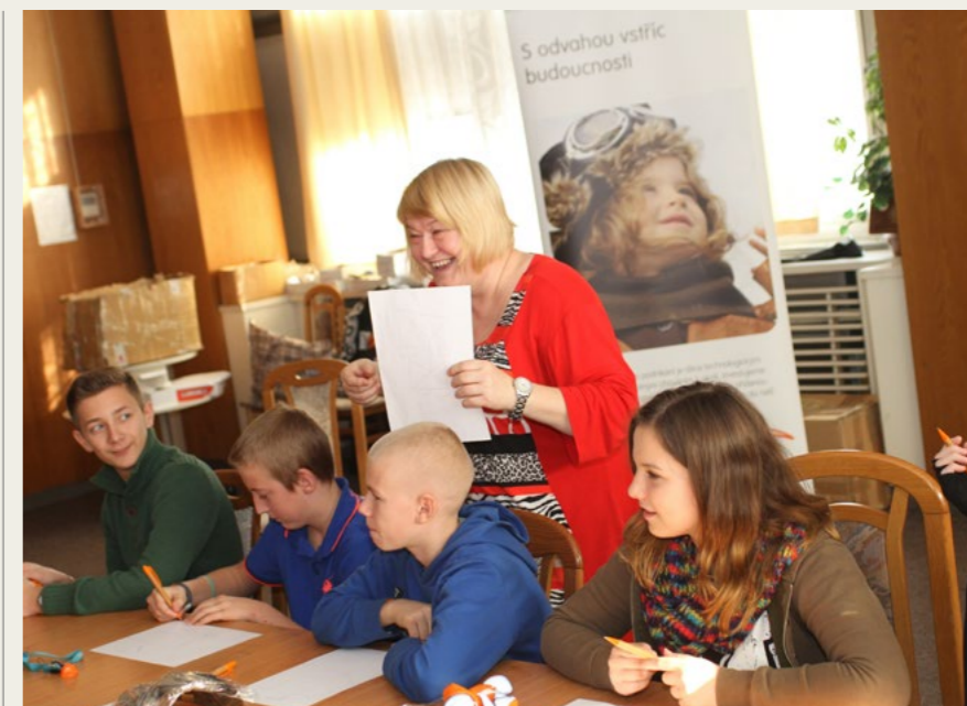
Společnost spolupracuje i se základními a středními školami. V prosinci přivítala huť 400 žáků ZŠ.