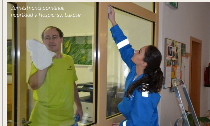
Zaměstnanci pomáhali například v Hospici sv. Lukáše

Sedmého ročníku Dne dobrovolnictví pořádaného hutí ArcelorMittal Ostrava se zúčastnilo 115 jejích zaměstnanců. Pátek 5. prosince strávili pomocí v 22 zařízeních v našem kraji. Pomáhali s úklidem, malováním místností i mytím oken, hrabali listí a štípali dříví nebo nadělovali dárky dětem a dělali společnost seniorům a hendikepovaným. Další desítky zaměstnanců se zapojily do charitativní sbírky a přispěly více než 400 kilogramy šatstva, knih, hraček a kuchyňských potřeb.