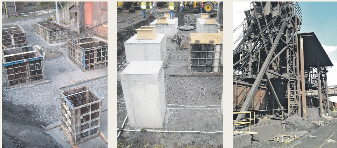
Výklopníky uhlí a rud se dočkají zakrytí a odprašení. Tento projekt je jednou z probíhajících ekologických investic