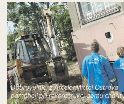
Dobrovolníci z ArcelorMittal Ostrava pomáhají při rekonstrukci domu charity

Zrekonstruovaný dům poskytne prostor pro kurzy zaměřené např. na získání finanční gramotnosti nebo na pomoc při vstupu na trh práce. Probíhat v něm bude i výuka vaření nebo práce na PC.