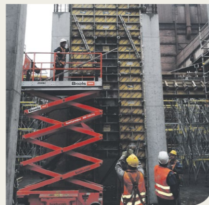
Práce probíhají i na jižní části aglomerace, která dostane nový tkaninový filtr. Tato nejlepší odprašovací technologie od roku 2011 funguje již na severní části