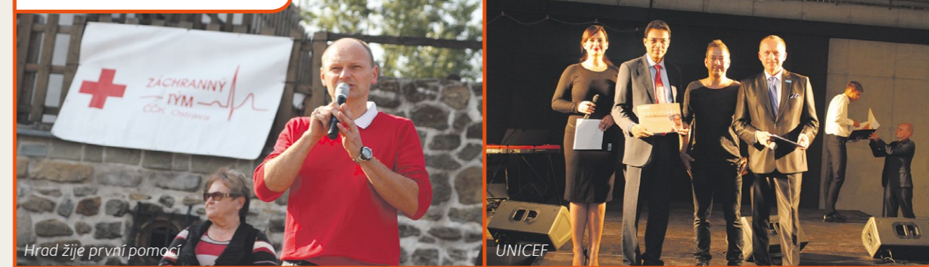
Hrad žije první pomoci