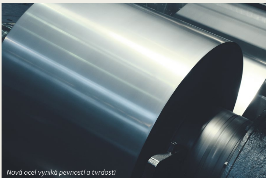
Nová ocel vyniká pevností a tvrdostí

Díky své pevnosti a tvrdosti je tato ocel vhodná pro automobilový průmysl (do brzdových systémů či bezpečnostních pásů), pro kovozpracující průmysl (výroba nožů nebo řetězů), ale také třeba pro obuvnictví (do výztuh bot). Frýdecko-místecká válcovna se s novým produktem zařadí po bok francouzské ArcelorMittal Dunkerque, doposud jediné pobočky skupiny ArcelorMittal v Evropě, která vysokouhlíkatou ocel vyráběla.