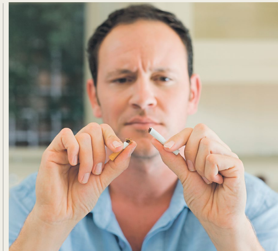
V ArcelorMittal Ostrava se od 1. září 2015 nebude kouřit