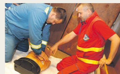
Zaměstnanci si mohli vyzkoušet podání první pomoci.

První týden v září se zaměstnanci ArcelorMittal Ostrava mohli zúčastnit akce Týden na podporu zdraví. Bohatý program letošního ročníku zaměstnancům nabídl bezplatná preventivní vyšetření, očkování proti chřipce nebo pohybové aktivity s následnou masáží.